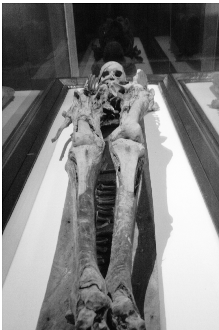
„Pamätaj, že si prach a na prach sa obrátiš“ - pre pustovníkov častý námet k meditácii

Kappadóciu nazývame kolískou cirkevných otcov. Najznámejšími svätými tohto regiónu sú sv. Bazil Veľký a sv. Gregor Naziánsky. Obaja boli