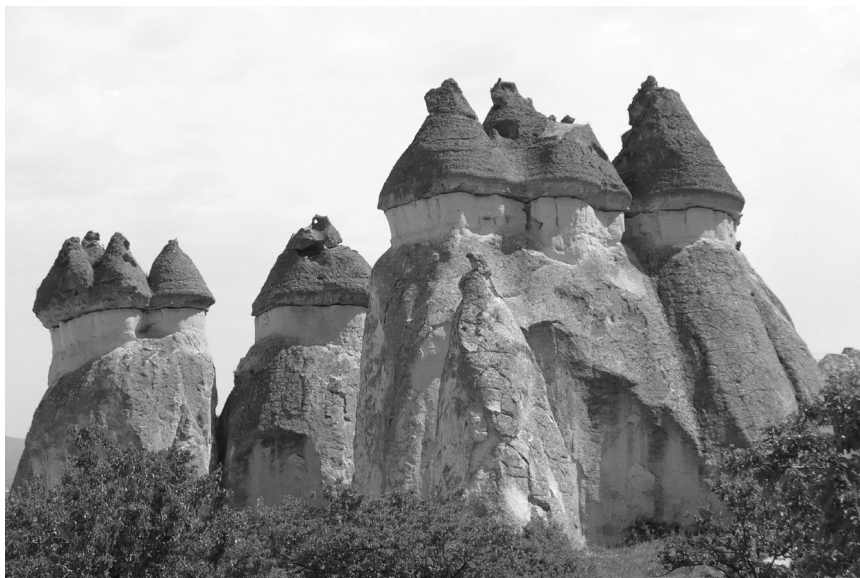
V Kappadócii sa príroda zahrála na výtvarníka

Je to jeden z najznámejších a najkrajších regiónov Turecka. Voda, vietor a slnko tu utvorili zo skál nádherné útvary. Do Kappadócie prichádzali prví kresťania v snahe uniknúť prenasledovaniu a v pozoruhodnej harmónii si tu vyhlúbili do pieskovcových skál príbytky a chrámy. Po vyhlásení kresťanstva za povolené náboženstvo sem prichádzalo ešte väčšie množstvo ľudí túžiacich žiť kontemplatívnym životom.