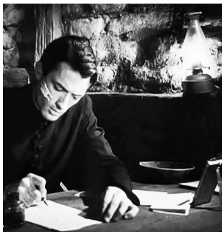
postavu mladého kňaza Chisholma, misionára v Číne, stvárnil vo filme z roku 1944 Gregory Peck

Slušnosť vyžadovala, aby sa Sleeth chlapco