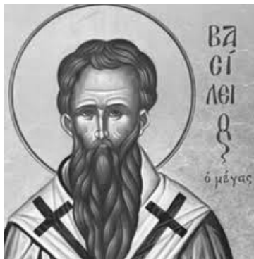
svätý Bazil Veľký

Pre dobu, v ktorej Bazil a Gregor žili (4. st.), bolo charakteristické hlásanie bludov v kresťanstve, predovšetkým arianizmu (popieranie božstva Ježiša Krista, tvrdenie, že Ježiš bol len človekom). Bazil i Gregor proti arianizmu bojovali. Nemali to ľahké – nedostalo sa im podpory ani od vtedajších cirkevných autorít. Tie predovšetkým Bazilov boj brali ako ctižiadostivú snahu vyniknúť, nie ako nasadenie obrániť a očistiť vieru. Uznania od Cirkvi sa Bazilovi dostalo až po smrti.