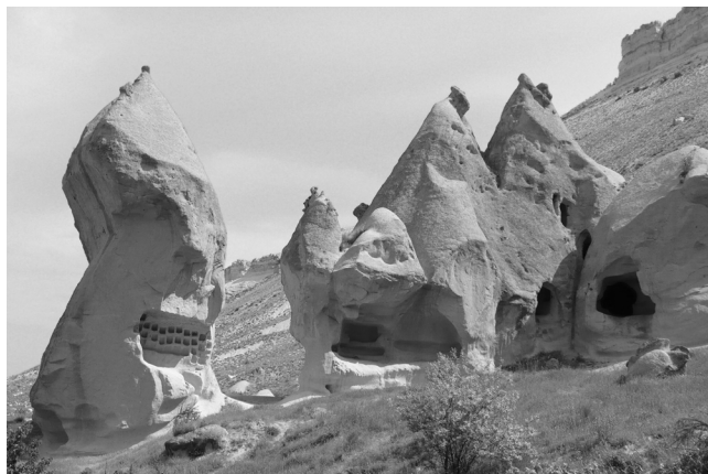
pustovníci si svoje príbytky vyhlbovali do skál

V celej Kappadócií sa nachádza asi 1000 kostolov a v okolí najznámejšieho mestečka Góreme, kde sú tieto pamiatky najviac koncentrované, sa ich nachádza asi tristo. Žiaľ, v Turecku sa kresťanským pamiatkam nedostáva dostatok pozornosti. Hoci sú obrovským kresťanským dedičstvom ľudstva, tu slúžia takmer výlučne ako obchodný artikel.